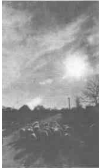
牧归 画连生 摄

河口。河口的治理，主要着眼于防洪，使之不决口、不改道。1952年在第一次大规模修堤工程期间，在山东垦利小口子村附近，将河段截弯取直，使入海的三股流路归一。1962年始再次加高加固堤防，加强控导和护滩工程。1975年又鉴于河道淤积严重，河口流路不畅，有准备、有计划地将黄河尾闾河道改由清水沟入海。之后，又通过整治河道，导控护滩，破除滩区生产堤和引洪障碍，来稳定河势。近几年来，与黄河命运休戚相关的有识之士和专家学者，为摸清黄河入海的基本规律，为稳定黄河的现行流路，或乘木船、橡皮船、气垫船或徒步跋涉，多次冒着生命危险进入变幻莫测的河口地带，做了大量的实地勘察工作。他们深入研究黄河尾闾的历史变迁和为患的成因，勾画了控制黄河流路的宏图。在此基础上，当地政府和胜利油田运用现代技术，采取了“截支强干，导流束水、射流破门、巧用潮汐、护滩定槽、宽河固堤、减沙改土”等一系列进攻性措施。通过引洪、蓄水、沉淤等人工的、机械的作用和自然力的发挥，来减沙入海，挖沙降河。河势不稳的另一重要因素，就是“拦门沙”作梗。入海的泥沙细粒，被潮流带离河口，月积年累，在河道及其两侧堆积成一道道舌状沙体，进而形成沙坝。这就是“拦门沙”。黄河在这里受到阻塞，无法顺畅下泄，只好另寻他路。为从根本上控制河势，几年来这里煞费苦心，运用多种手段，终于冲开了“拦门沙”。通过几年的实践，使河口的治理，有了新的突破。1988年后连续三年，