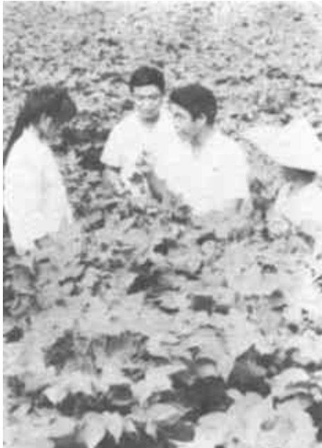
东营区油郭乡深化农村改革，建立了科技、农机等四个服务中心，取得了良好的经济效益和社会效益。图为科技服务中心人员正在指导棉农治虫。

1988年8月，三里村在县工商局的帮助下，投资45万元建起了占地20亩的我市第一个村办综合批发市场。这个市场有经营房210间，仓库41间。从市场启用到现在6月，村里共收房租费55万元。三里村97户人家，围绕市场做生意的70户，年户均收入8000余元。这个批发市场的繁荣，促进了国营集体企业的发展。据不完全统计，广饶的一些国营、集体企业的产品和商品，通过该市场批发的每年在470万元以上。县糕点厂每年40%的产品通过这个市场批发。县酒厂每年通过这个市场销出124万元的白酒。县烟草公司、县副食品公司、县日用杂品公司，每年在市场上的成交额都达近百万元。同时，市场上的经营者们与全国500多家工厂签有购销合同。这个批发市场搞活了农村商品流通，促进了农村商品经济的发展。花园乡以市场为依托，有5个村、120户经营制糖专业，每年生产糖块900万公斤，大部分在这个市场上销出。现在这个市场上有坐商200户，从业人员500多人。该市场向国家上交税收35万元。(盛旭)