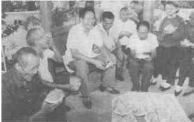
东营区牛庄镇镇委、镇政府领导到敬老院看望老人们。

本报讯 8月15日至20日，市石油分公司开展了“石油之窗”评估活动。他们请前来购油、购气的顾客和用户开展这一活动旨在检验社教整改成果，推动优质服务竞赛上水平。(文东)